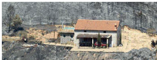
Terrain débroussaillé = maison sauvée

Une fois le feu passé, couvrez-vous les membres et la tête, chaussez-vous correctement et sortez toujours du côté opposé à l'arrivée du feu. Faites le tour du bâtiment pour éteindre les foyers résiduels.