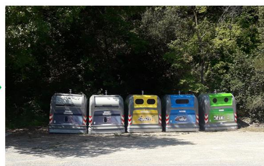
Evolution d'un point bacs en point d'apport volontaire à Ampus (Mobilier métal)