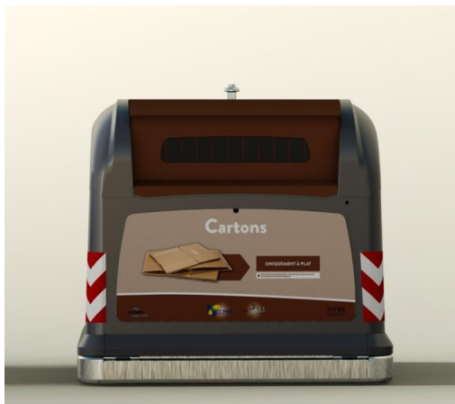
Colonnes de tri cartons en métal