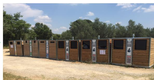
Évolution d'un point bacs en point d'apport volontaire à Sillans-la-Cascade (Mobilier bois)