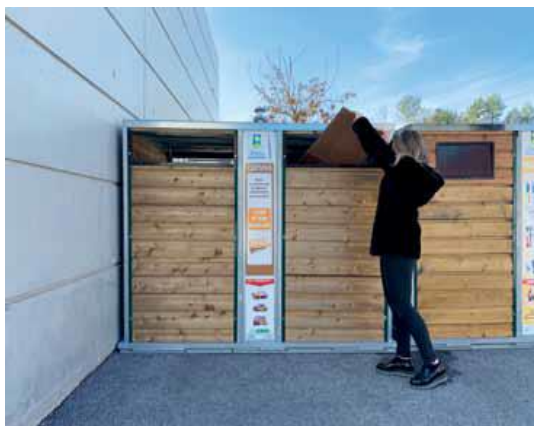
Colonnes de tri cartons en bois

L'implantation des nouvelles colonnes sont répartis sur les 23 communes, sur les PAV les plus performants.