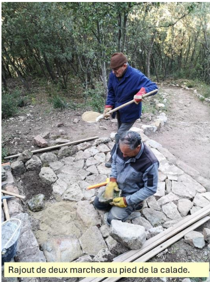
Rajout de deux marches au pied de la calade.