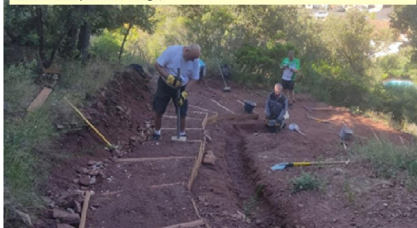
Modification et déplacement des marches en bois qui permettent l'accès aux ruines à partir du village,