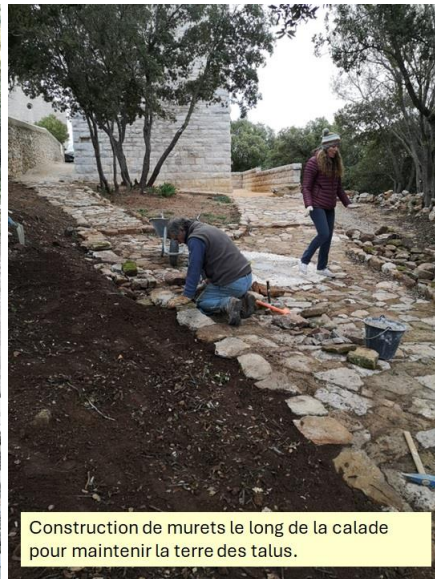
Construction de murets le long de la calade pour maintenir la terre des talus.