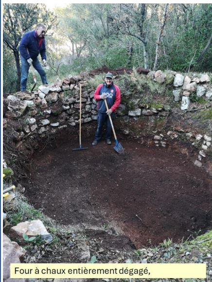
Four à chaux entièrement dégagé,

En plus de tous ces travaux, nous continuons l'entretien du sous-bois et de l'Oppidum. Nous organisons régulièrement des visites guidées de l'oppidum et des vestiges du village médiéval.