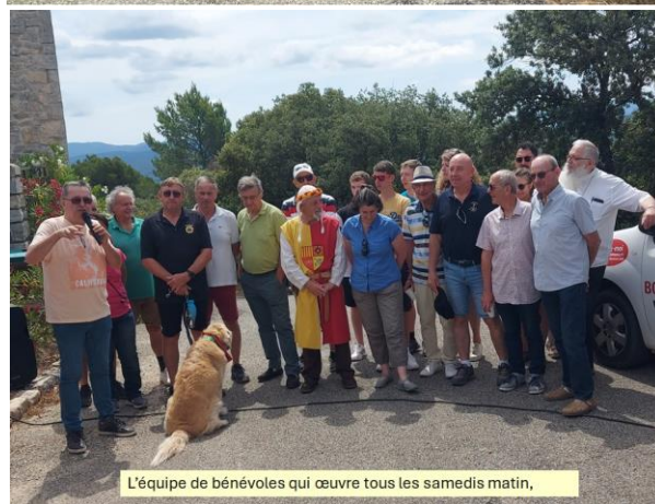
L'équipe de bénévoles qui œuvre tous les samedis matin,