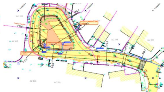
Impasse de la Tour

L'accès aux propriétés riveraines et véhicules de secours, rendu difficile du fait du chantier, sera toujours assuré par l'entreprise. A contrario, le stationnement sera totalement interdit pendant toute la durée des travaux sur l'ensemble des voies.