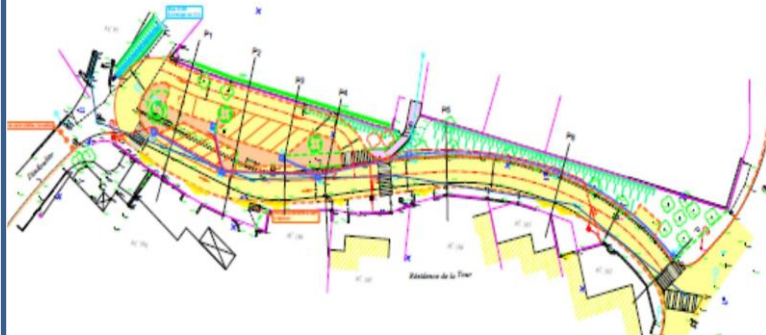
Rue de la Tour

Divers objectifs en ces lieux : la réalisation de ces travaux permettra l'utilisation des espaces libres pour aménager des emplacements de stationnement (14 à 15 dont handicapés pour la rue de la Tour, 9 pour l'Impasse), la création d'un sens unique partiel permettant le ½ tour sans manœuvre, de calibrer les chaussées en double sens à 5m, assurant le croisement aisé de deux voitures, refaire l'ensemble des réseaux, chaussées, trottoirs, replantation d'arbres.