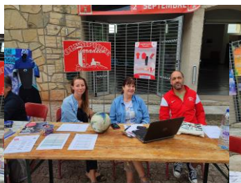
Olympique Taradeau Foot