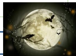
Planche 10+2 : 30 € - Bingo : 5 €. Renseignements 0637251377

1 Carton : 4 € - 4 Cartons : 14 € - 6 Cartons 20 €