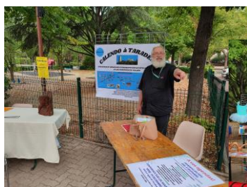
Calendo à Taradeau