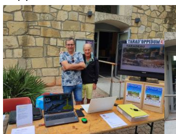
Accueil Amitiés et Tarad'Oppidum