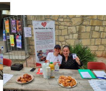
Les Randos du Cœur