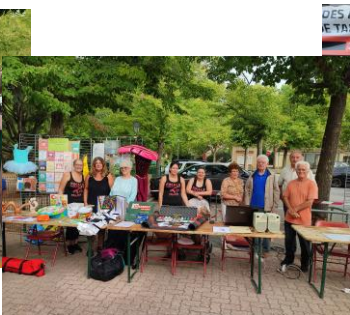
Le Foyer Rural