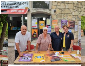
Le Comité des Fêtes