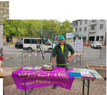
Le Poisson d'Argens