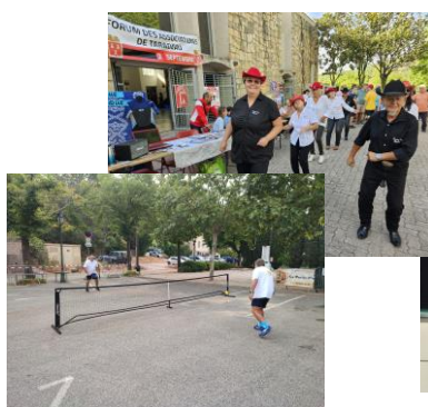
De nombreuses démonstrations ont eu lieu (pickle ball, country, twirling bâton)