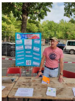
Sports et Loisirs Taradéens