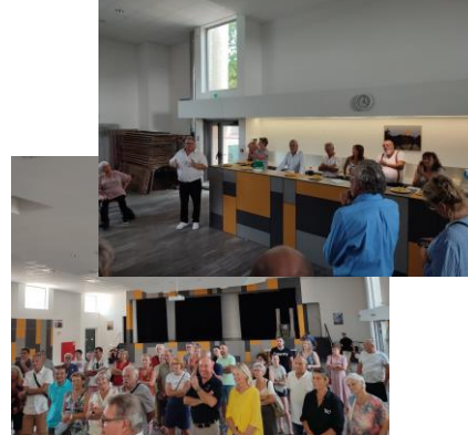
Accueil des nouveaux taradéens par Mr le Maire