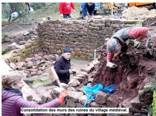
Consolidation des murs des ruines du village médiéval.