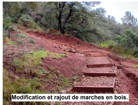
Modification et rajout de marches en bois.