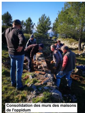
Consolidation des murs des maisons de l'oppidum